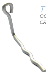
TYPE HSBW-P OOGANKER W PLAT CROCHET À OEUILLET W PLAT