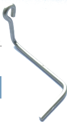
TYPE HSBL-P OOGANKER L PLAT CROCHET À OEUILLET L PLAT